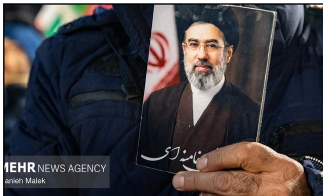
IEHR NEWS AGENCY anieh Malek

واشنگتن سخت‌تر می‌سازد. تحلیلگران معتقدند این رویکرد تازه می‌تواند دونالد ترامپ را بیش از پیش مایوس کند و روند مذاکرات را پیچیده‌تر نماید؛ حتی احتمال آغاز دوباره جنگ نیز مطرح شده است. رئیس‌جمهور امریکا در چندین نوبت پیشنهادهای ایران را به دلیل عدم توجه به پرونده هسته‌ای رد کرده و تهدید به حمله مجدد کرده است. ترامپ که پیش‌تر خواستار برچیدن کامل برنامه هسته‌ای ایران بود، اخیراً با توقف ۲۰ ساله‌ی آن موافقت کرده است. با این حال، او از تهران می‌خواهد ذخایر اورانیوم غنی‌شده‌ی خود را به ایالات متحده تحویل دهد. ایالات متحده، رژیم اسرائیل و برخی کشورهای غربی سال‌هاست ایران را به تلاش برای دستیابی به سلاح هسته‌ای متهم می‌کنند. اما مقامات ایرانی همواره این ادعا را رد کرده و تأکید دارند که برنامه هسته‌ای‌شان صرفاً اهداف صلح‌آمیز را دنبال می‌کند.